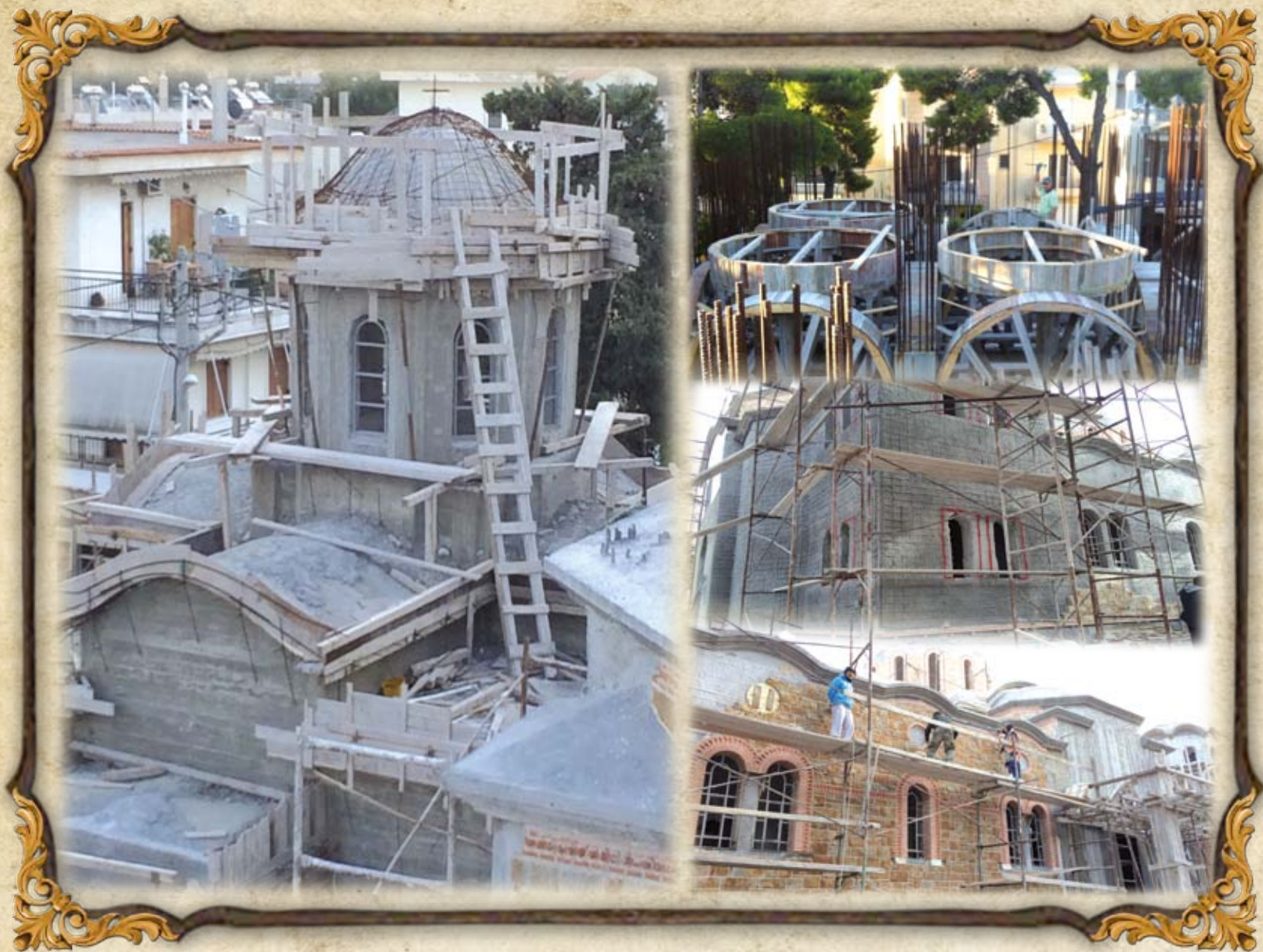
Από τὰ ἔργα τοῦ Ναοῦ τὸν Φεβρουάριο τοῦ 2015