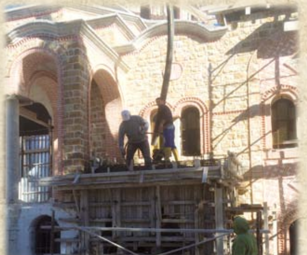
Από τὰ ἔργα τοῦ Ναοῦ τὸν Φεβρουάριο τοῦ 2016