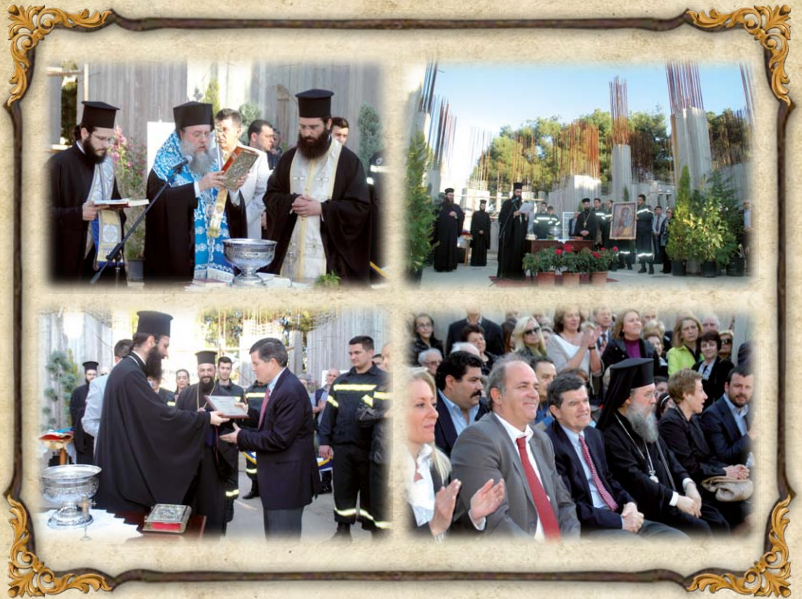
Ἀπὸ τὸν Ἅγιασμό ἐνάρξεως τῶν ἔργων τοῦ Ναοῦ (12-4-2013)