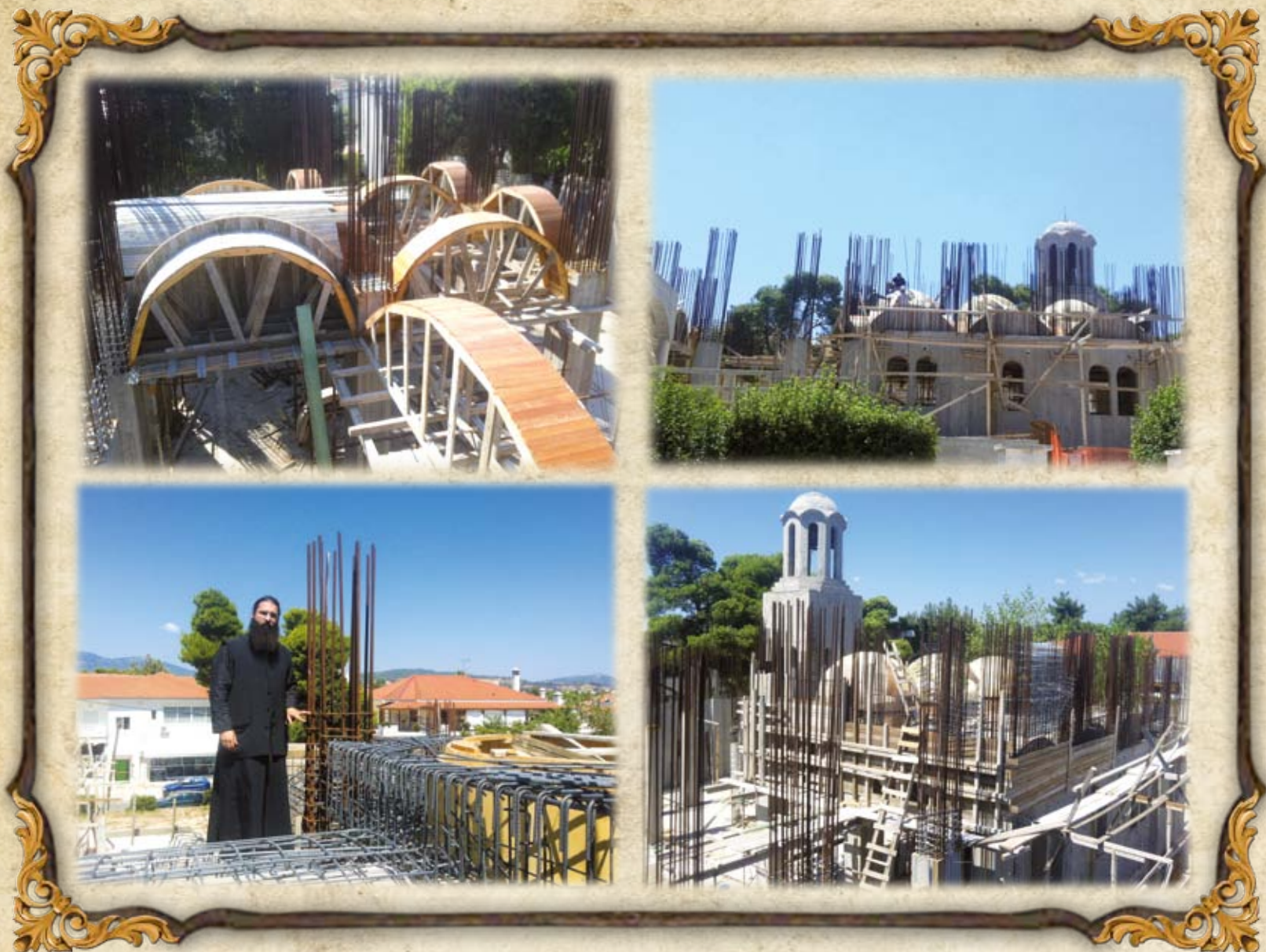
Από τα έργα του Ναού τον Ιούλιο του 2013