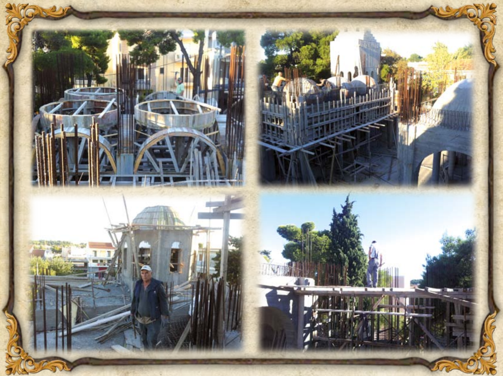
Από τὰ ἔργα τοῦ Ναοῦ τὸν Ὀκτώβριο τοῦ 2013