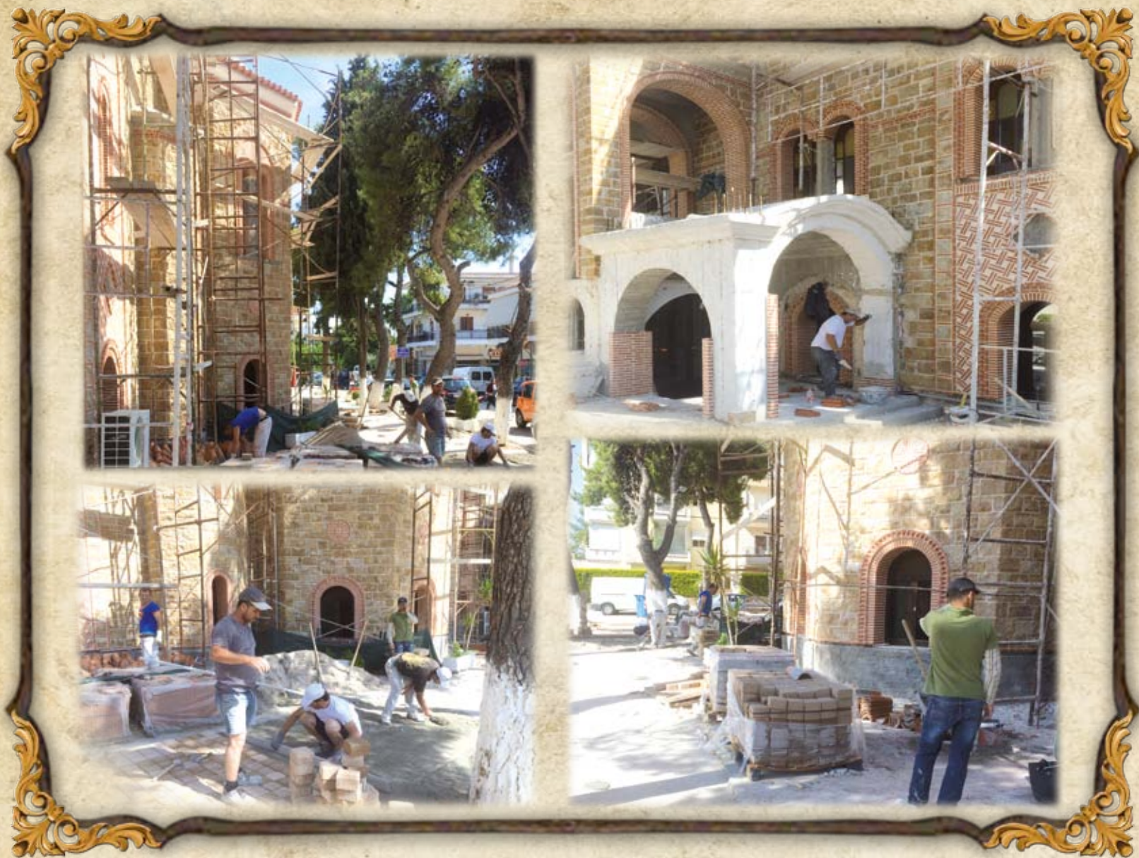
Από τα έργα τοῦ Ναοῦ τὸν Ἰούνιο τοῦ 2016