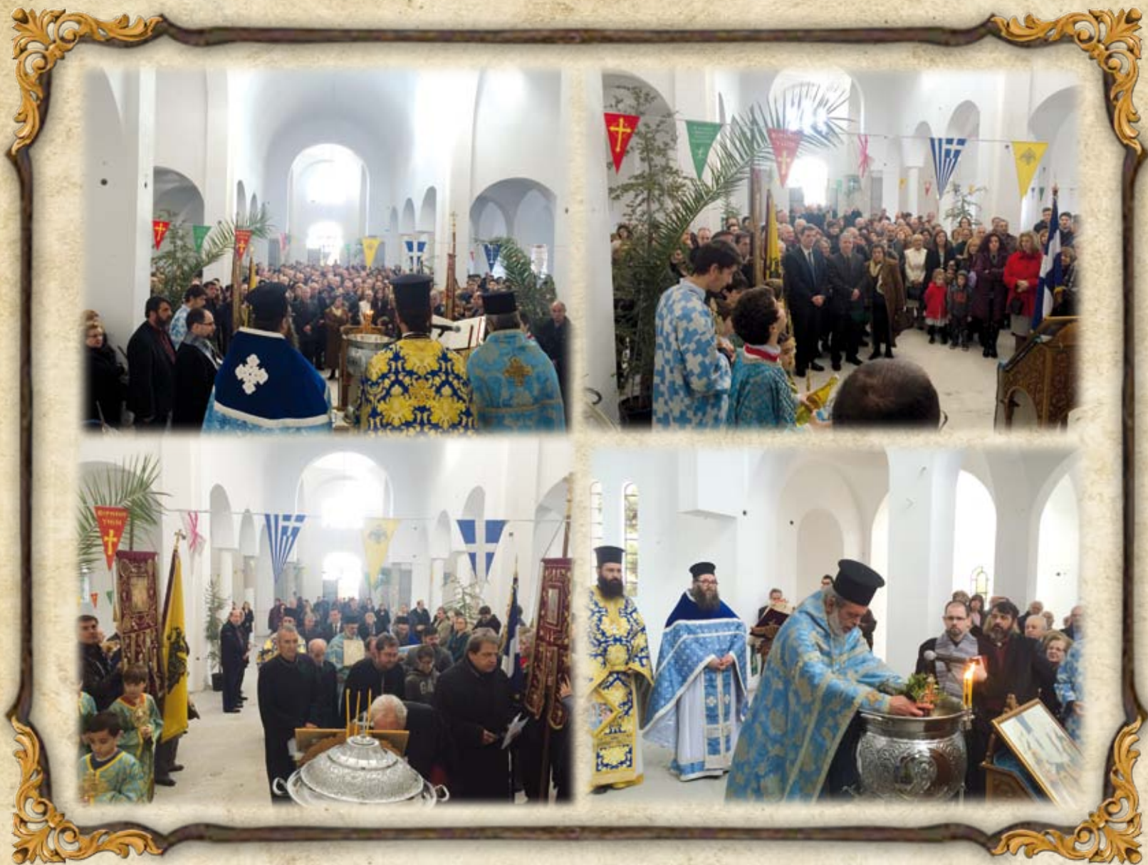
Από την ακολουθία του Μ.Αγιασμού εντός του νέου Ναού τον Ιανουάριο του 2016