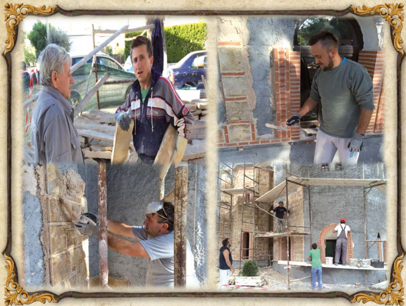
Από τὰ ἔργα τοῦ Ναοῦ τὸ Νοέμβριο τοῦ 2015