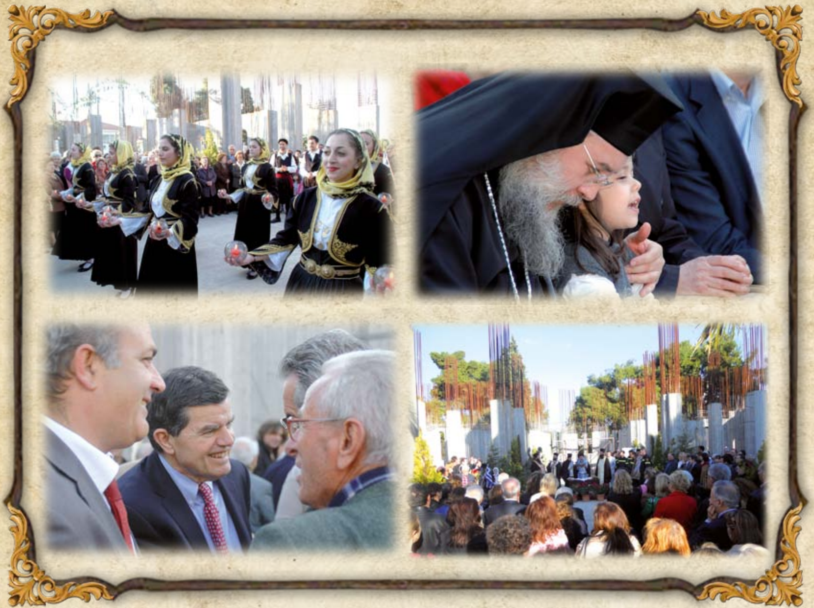
Ἀπὸ τὸν Ἅγιασμό ἐνάρξεως τῶν ἔργων τοῦ Ναοῦ (12-4-2013)