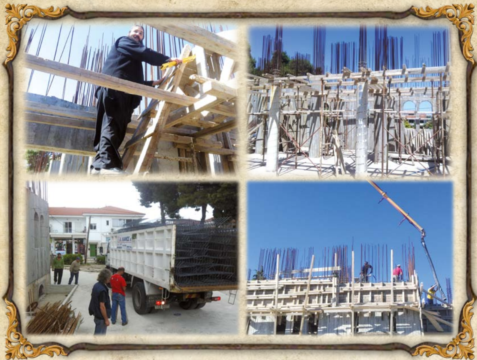
Άπο τὰ ἔργα τοῦ Ναοῦ τὸν Μάιο τοῦ 2013