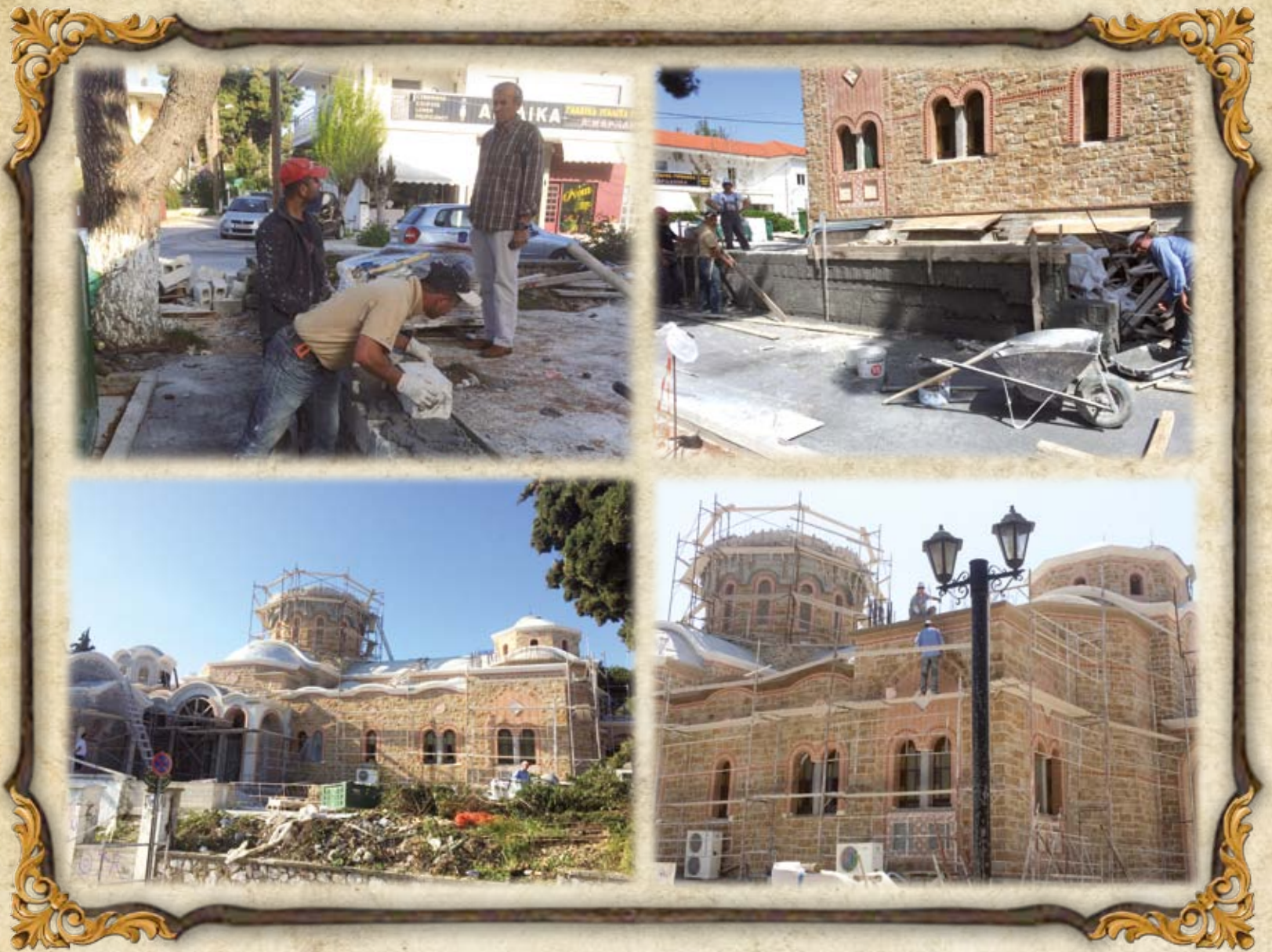
Από τὰ ἔργα τοῦ Ναοῦ τὸν Ἀπρίλιο τοῦ 2016